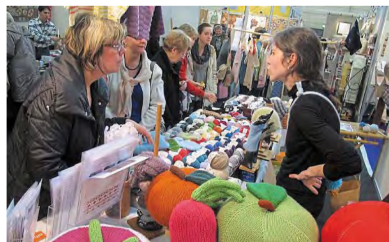
Fils croisés est le rendez-vous des passionnés de la couture et du tricot.