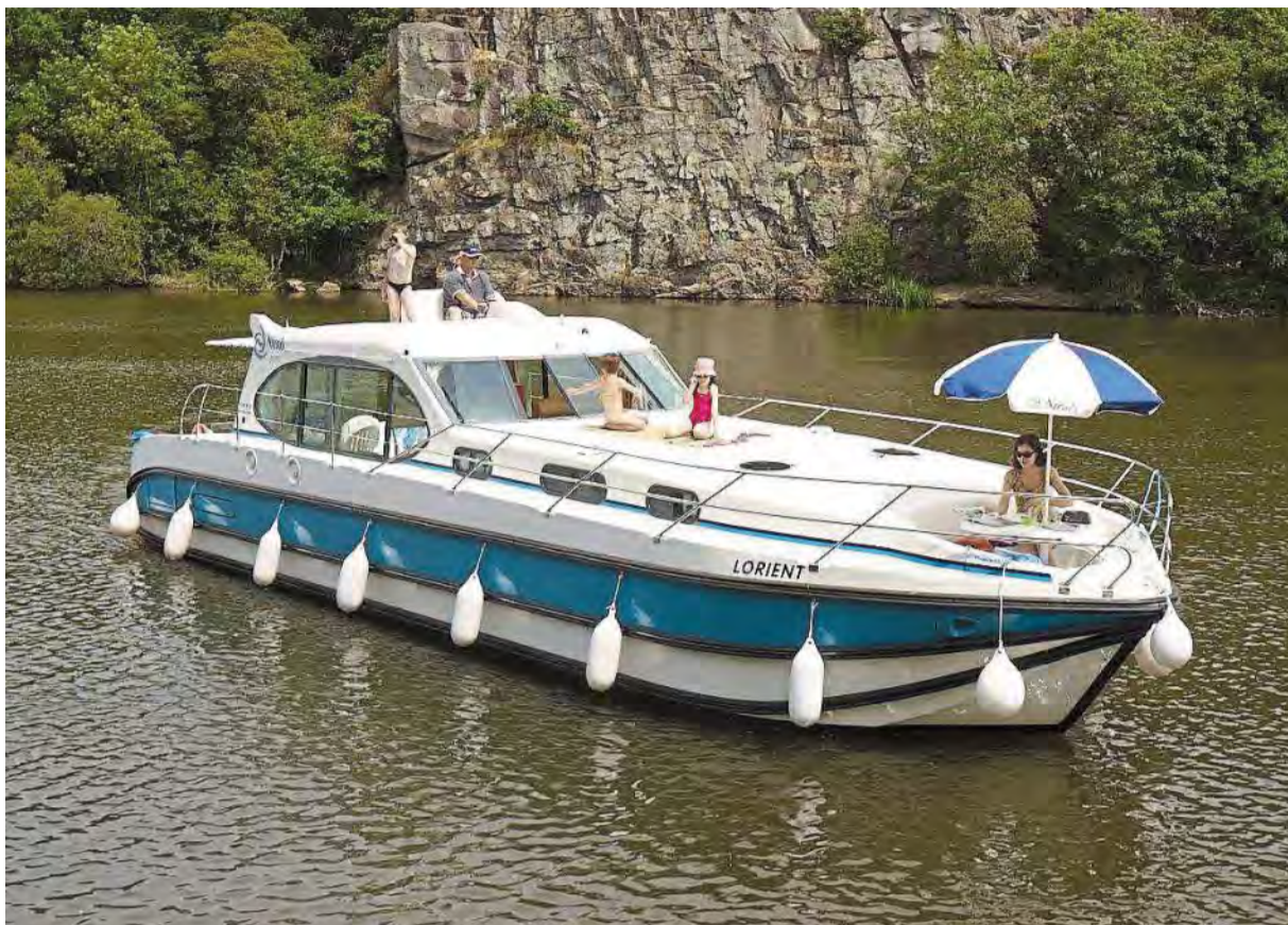
Un bateau tel que ce Nicols Octo de 13,50 m, que tout un chacun peut piloter sans permis, voguera sur les rivières de Hongrie en 2020.