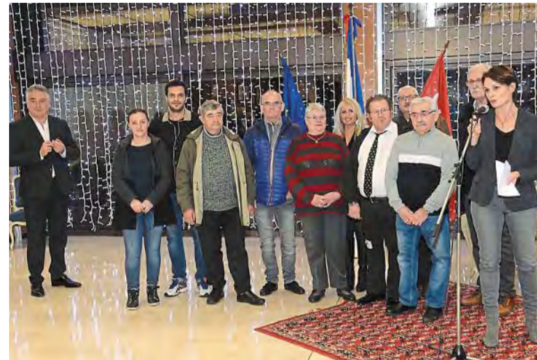
Différentes associations ont été mises à l'honneur. Ici, la Banque alimentaire.